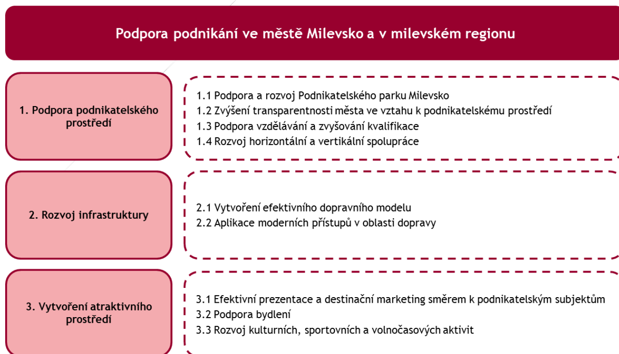
Obrázek 1 Strategie v oblasti rozvoje podnikání

Cílem 3 níže uvedených cílů a 9 opatření je naplnit vizi „ S podnikatelským parkem nastartovat rozvoj města Milevsko. “, která byla navržena Zpracovatelem v rámci prioritní osy Podpora podnikání ve městě Milevsko a milevském regionu a následně schválena Objednatelem. Opatření jsou dále blíže rozpracována na konkrétní aktivity, které má město Milevsko ve střednědobém horizontu začít realizovat, aby docházelo k naplňování vytyčených cílů. V Implementační části Strategie jsou pak aktivity zaneseny do časové osy, resp. do harmonogramu implementace.